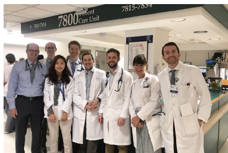
學生於杜克大學醫院見習

美國 布朗大學 杜克大學 匹茲堡大學 瑞士 伯恩大學 日本 熊本大學 宮崎大學 新加坡大學等名校